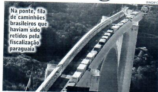
fiscalização desnecessária na saída do Paraguai e isso pode levar ao desabastecimento dos mercados e problemas ao mercado bilateral", alerta o presidente do SindiFoz.

O Sindifoz e outras entidades do setor tentam uma negociação com o Codena e o Ministério dos Transportes Paraguai para mudar a situação, pois temem uma greve da categoria. "Nós tentamos negociar com os órgãos responsáveis, enviamos uma carta para o Codena e um ofício ao ministro dos transportes e esperamos que nos próximos dias a situação possa ser resolvida porque já tivemos ameaça do lado brasileiro de tentar impedir a ida de caminhões para o lado paraguaio, já que o país segura eles lá dessa forma... tememos que a greve possa se concretizar caso a situação não mude. Os caminhoneiros brasileiros podem parar devido a esse excesso de