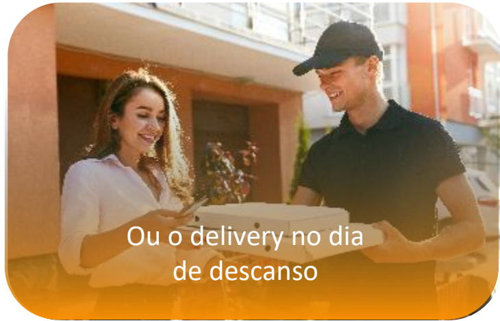
Ou o delivery no dia de descanso