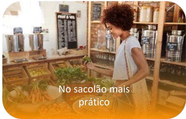
No sacolão mais prático