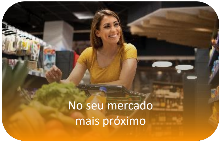
No seu mercado mais próximo