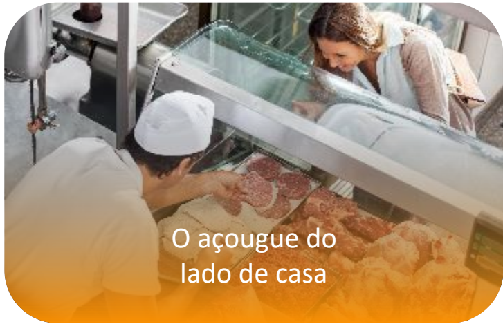
O açougue do lado de casa