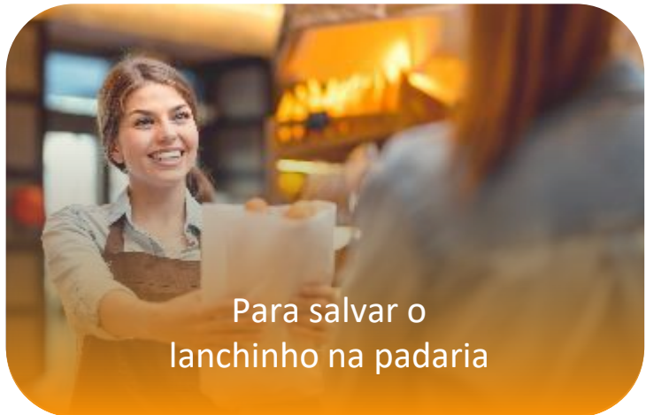
Para salvar o lanchinho na padaria